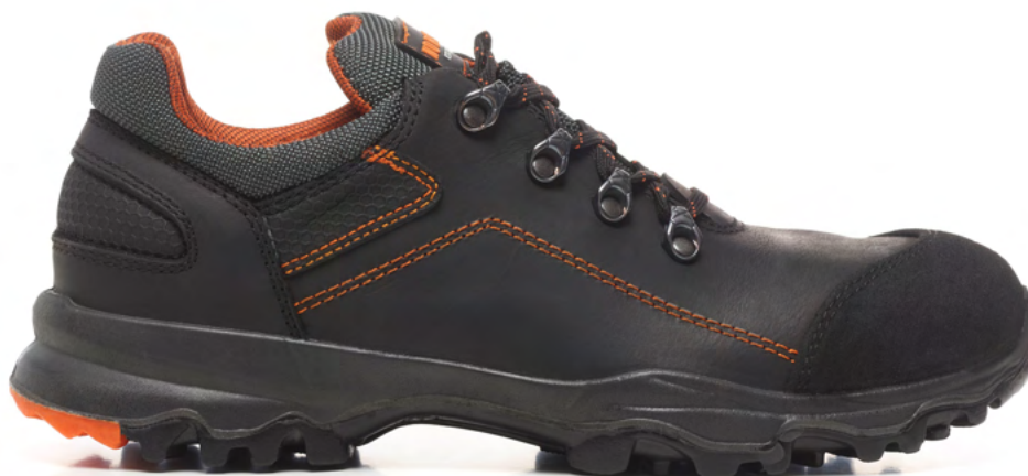
ATLANTIS 1229.00 EN ISO 20345:2022 C€ S3L HI CI SR FO