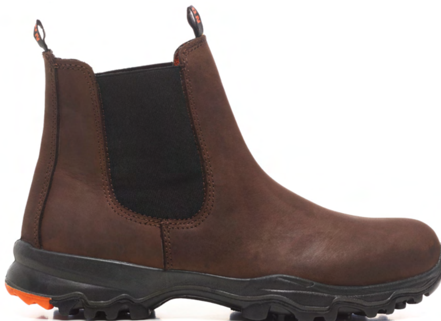
NASA 1017.02 EN ISO 20345:2022 C€ S3L HI CI SR FO